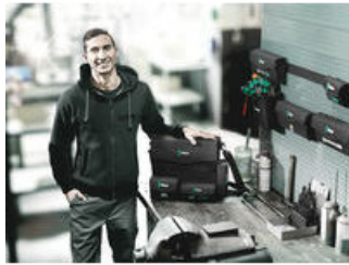
Wera 2go 2 - Der Dran- und Drinpacker